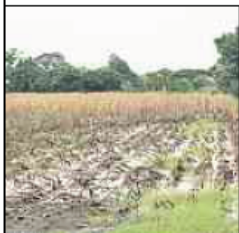
El exceso de humedad perjudicó los cultivos de maíz.