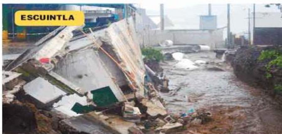
Muros y viviendas han sido dañados por las correntadas.