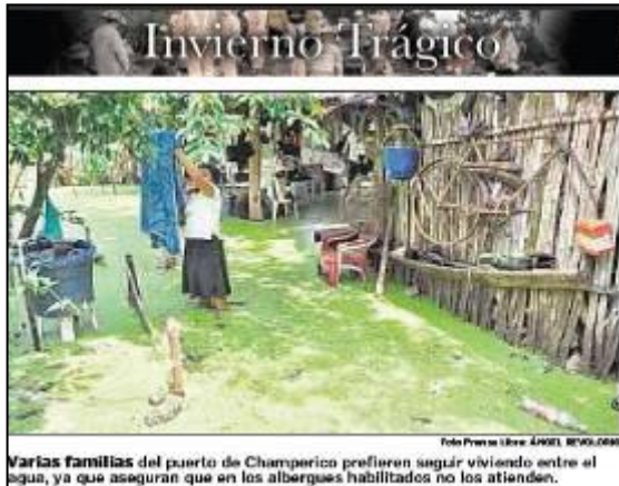
Varias familias del puerto de Champerico prefieren seguir viviendo entre el agua, ya que aseguran que en los albergues habilitados no los atienden.